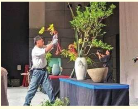
花いけパトロール

第3部では、岐阜県内の高校生が22部門に分かれ、それぞれの特性を生かした発表を皮切りに、2年間の準備を経て実行委員生徒たちの熱意が伝わる内容が続々と披露された。計画と実施に携わった生徒たちの努力が感じられるスムーズな進行が印象的だった。最後に、生徒実行委員全員がステージに立ち、苦悩と努力の日々を振り返りながら感謝の言葉を述べた。観客からの拍手は鳴り止まず、吹奏楽部門へ合唱部門の演奏とともに大会イメージソングが合唱された。大会は感動のうちに幕を閉じた。