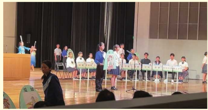
各都道府県代表生徒挨拶

第2部では、開催地岐阜県と次年度開催地の香川県の交流が行われ、花いけパトロールと並行して両県の魅力を発表。郷土料理や各県の特徴が紹介され、会場は一層の盛り上がりを見せた。続いて、来年度の総文祭に関するPRが行われた。