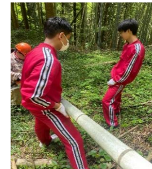
【写真】 森の包括支援センターと連携して、日の出町の放置竹林を整備している様子